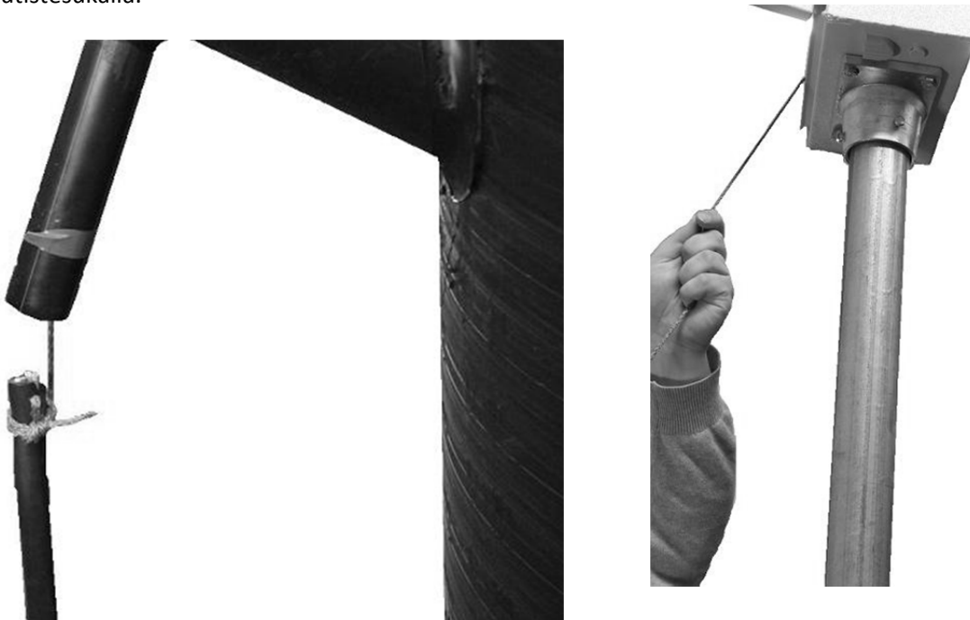
Kuva 2. Sähkökaapelin tuonti

Sido sähkökaapeli läpiviennistä tulevaan naruun ja vedä kaapeli ohjauskeskukselle (kuva 2). Kytke johdot kytkentäkaavion mukaisesti vasta kun se on turvallista. Sähkönjohdon läpivienti tulee tiivistää esimerkiksi kutistesukalla.