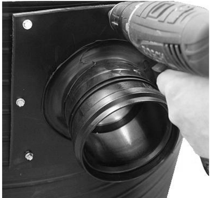
Kuva 4. Jälkiliittymäsatulan kiinnitys

Työnnä tuloputki yhteeseen ja varmista, että se menee tukevasti pohjaan asti. Pumppaamoon voidaan johtaa jätevettä useammasta kohteesta lisäämällä siihen tarvittava määrä tuloyhteitä.