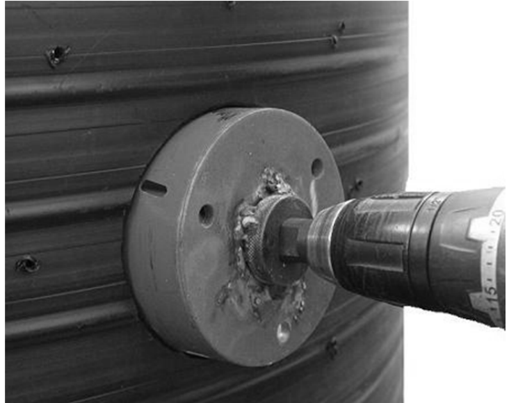
Kuva 3. Reiän poraus jälkiliittymäsatulalle

Katso tuloyhteelle paikka pumppaamon kyljestä ja tee reikäsahalla halkaisijaltaan 114 mm reikä jälkiliittymäsatulalle (kuva 3). Poista työstöjätteet reiän alueelta.