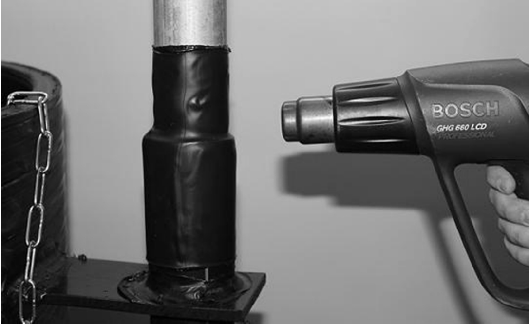
Kuva 1. Kutistesukan asennus

Nosta ohjauskeskuksen jalka pystyasentoon. Kiri jalka paikalleen kolmella laipassa olevalla pultilla ja tiivistä jalan alaosa kutistesukalla. Kutistesukkaa voi lämmittää esimerkiksi kuumailmapuhaltimella tai kaasupolttimella (kuva 1).